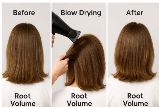
▷블로우드라이를 이용한 뿌리볼륨 스타일링