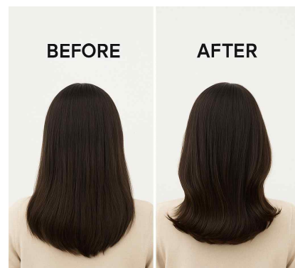
▷아이론을 이용한 C컬 스타일링